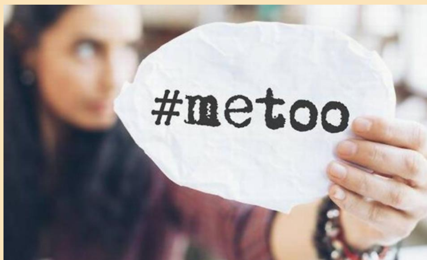
Cette photo par Auteur inconnu est soumise à la licence CC BY-SA